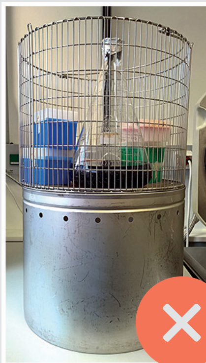
NICHT MIT FESTKÖRPERN