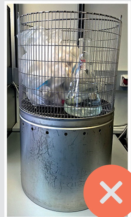
NICHT MIT FESTEM ABFALL