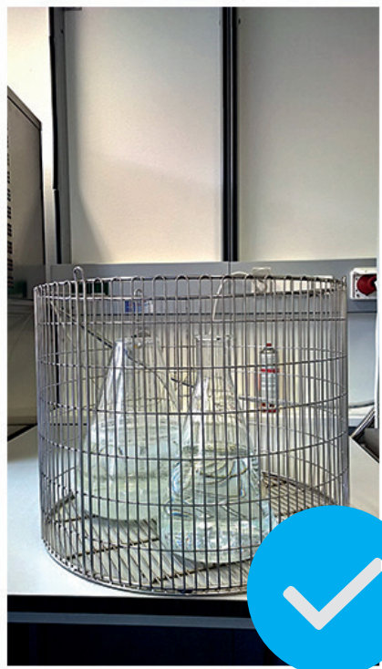
IMMER IM KORB