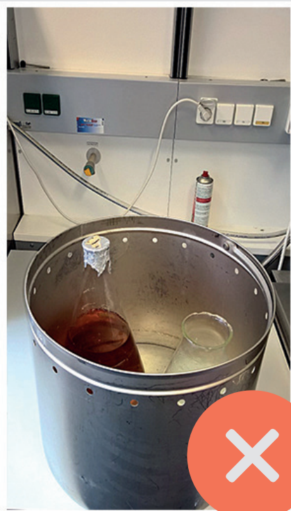
NICHT IM EIMER

** sollte in Größe und Füllvolumen mind. dem größten mit Medium gefüllten Gefäß entsprechen