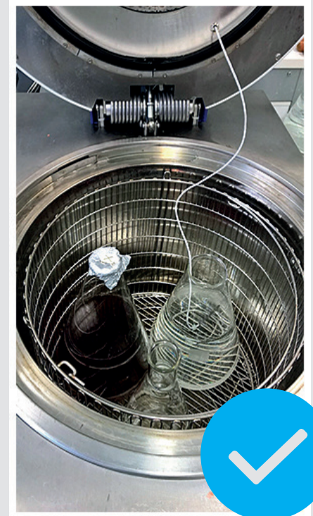
FÜHLER IN EIN REFERENZGLAS** MIT WASSER GEBEN

** sollte in Größe und Füllvolumen mind. dem größten mit Medium gefüllten Gefäß entsprechen