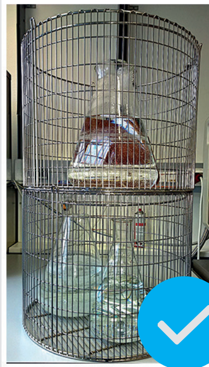
IMMER IM KORB